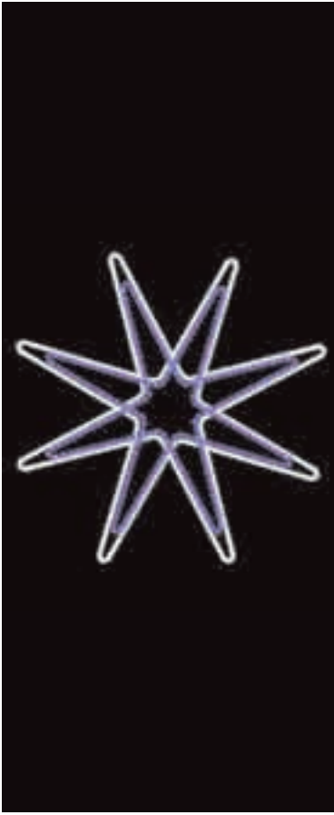
Estrella de ocho puntas, blanca por el exterior y azul por el interior Estel de vuit puntes, blanc per l'exterior i blau per l'interior