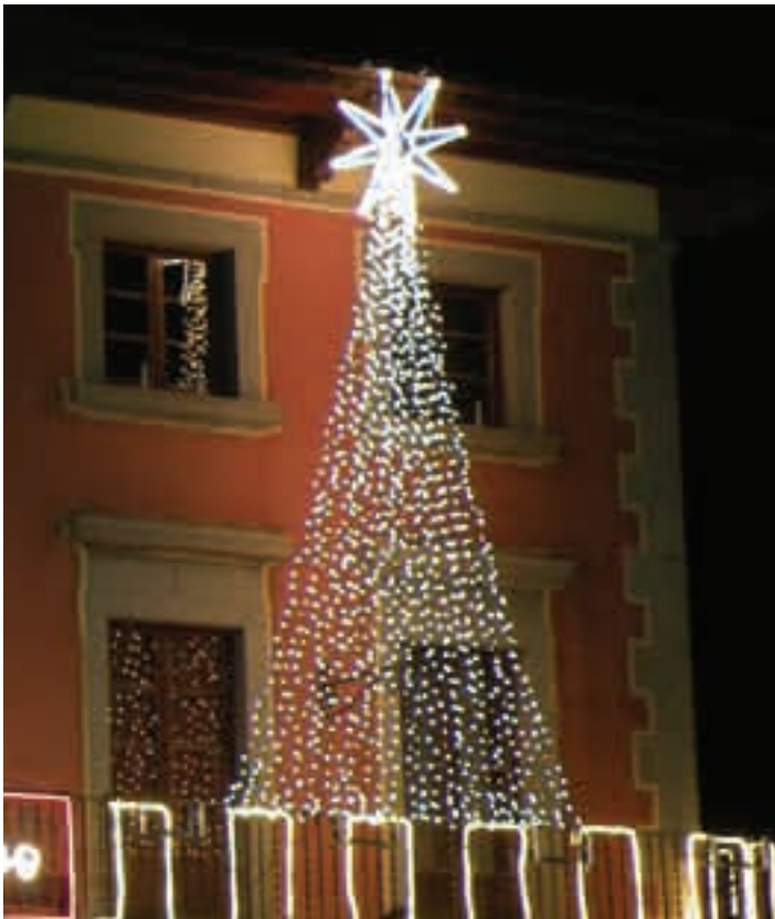
Montaje de una estrella con una cortina recogida en la parte superior Muntatge d'un estel amb una cortina recollida a la part superior