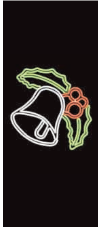
Campana blanca, hojas verdes y frutos rojos. Campana blanca, fulles verdes i fruits vermells