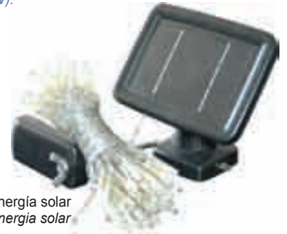
Energía solar Energia solar

Una figura actual basada en tecnología LED de 40 Watios consumiría comparativamente 112.5W si usara Microbombilla, 250W con minibombillas u 6.250 watios con bombillas tipo feria de abril.