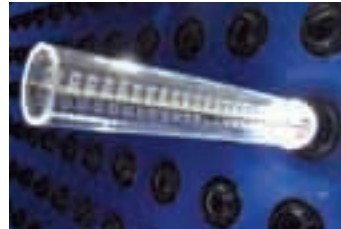
Nuevos productos Nous productes