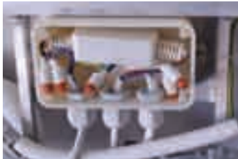
Elementos de seguridad Elements de seguretat

El uso de bombillas de 25 Watios, tipo "Feria de Abril", era normal hace 15 años. En ese momento la sustituimos por minibombillas de 5W y 5 años más tarde pasamos al cordón luminoso de microbombilla (0.45w). Actualmente estamos pasando al LED (0.16W).