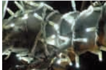
Bajo y Muy bajo consumo Baix i molt baix consum