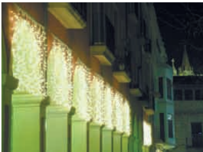
Montaje al aire a favor de gravedad (Foto: prov Tarragona) Muntatge a l'aire a favor de gravetat (Foto: prov Tarragona)