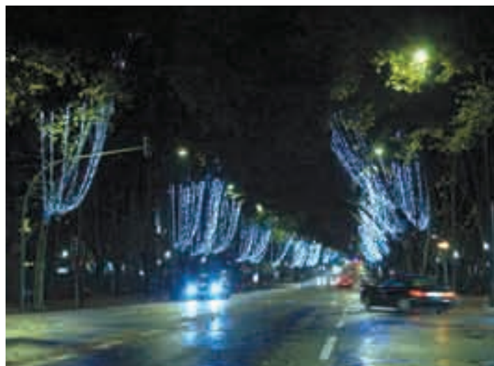
Montaje en arboles contra gravedad (Foto: Lisboa - Portugal) Muntatge en arbres contra gravetat (Foto: Lisboa - Portugal)