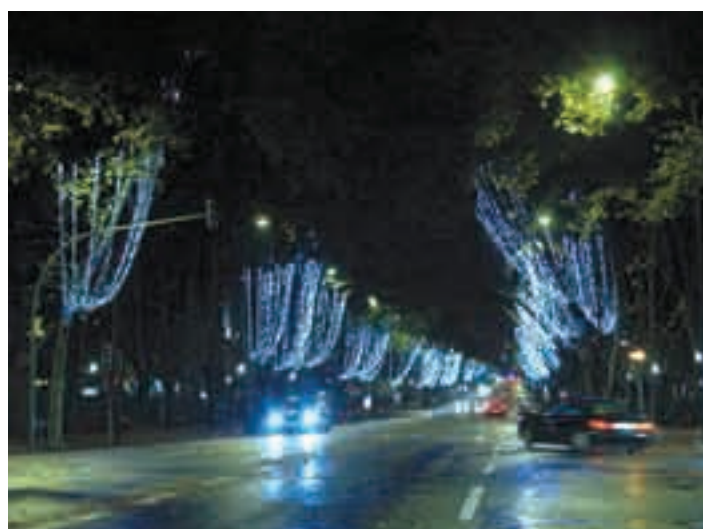
Montaje en arboles contra gravedad (Foto: Lisboa - Portugal) Muntatge en arbres contra gravetat (Foto: Lisboa - Portugal)