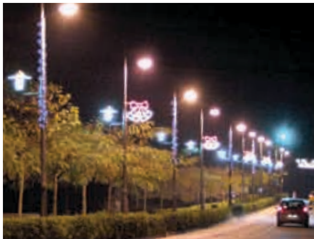
Guirnalda SOLAR LED enrollada en farolas- prov. Barcelona Garlanda SOLAR LED enrotllada a fanals - prov. Barcelona