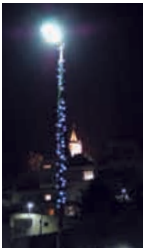
Montaje en farola - Prov BCN Muntatge a fanal - Prov BCN