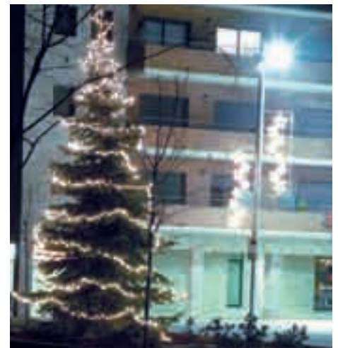
Guirnalda SOLAR LED en Aveto - prov. Barcelona Garlanda SOLAR LED en Avet - prov. Barcelona